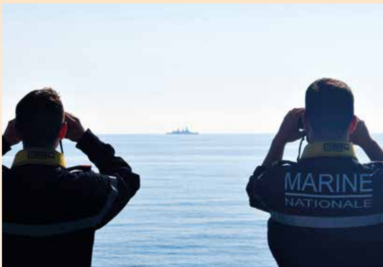
... Exercice de lutte anti sous-marine avec une frégate

de la montée en puissance de la maîtrise des fonds marins. Il y a en effet deux aspects dans le développement de ce type d'engin : d'une part l'assistance aux sous-marins habités, d'autre part son emploi pour de multiples tâches comme la recherche d'épaves ou d'objets et la surveillance des câbles sous-marins. La majorité des données qui transitent dans le monde se font via ces câbles (on en compte 1500 pour l'instant) qui traversent les océans. C'est un sujet d'attention particulier parce que les communications sont le nerf de la guerre. D'autant que des nations mal intentionnées peuvent être en mesure de les sectionner. L'objectif ici à court terme, c'est de pouvoir surveiller efficacement la totalité de ces câbles et des hubs qui permettent d'amplifier les signaux. Pour l'instant, ces drones sont capables de descendre jusqu'à 1 500 mètres de profondeur. L'objectif d'ici 5 ans, c'est de pouvoir les amener à 6 000 mètres. Suite à cette première phase d'expérimentation achevée avec succès, l'équipage de la Seine a repris la mer vers son port base. Vivement la prochaine mission ! ■