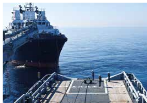
... Entraînement au remorquage avec un navire civil

« Étant natif d'un petit port de pêche de Normandie qui s'appelle Barfleur, j'ai toujours voulu naviguer. L'armée m'en donne aujourd'hui l'opportunité ! Lorsque je suis entré au lycée, j'ai suivi pendant quelques week-ends une préparation militaire pour savoir si cela allait me plaire. J'ai tout de suite adhéré ! Ainsi, après mon bac, j'ai intégré une école de matelots. Cela commence par 4 semaines de formation initiale. Marcher au pas, comprendre le fonctionnement des grades, connaître les bases de la sécurité... on y apprend en somme à devenir militaire. Par la suite, on choisit sa spécialité. Personnellement, j'ai choisi de devenir manœuvrier. Accostage, appareillage, remorquage... littéralement, il s'agit de la partie manœuvre du bateau. J'ai alors intégré l'équipage B du BSAM Seine. Cela fait désormais 2 ans. Aujourd'hui, j'ambitionne de passer sous-officier et devenir ainsi chef d'équipe. Je commence l'école en décembre pour terminer en avril. En sortie de cours, on choisit les affectations. J'aimerais bien naviguer sur un bateau spécialisé, un ravitailleur ou une frégate par exemple. Cela va dépendre de mes résultats. »