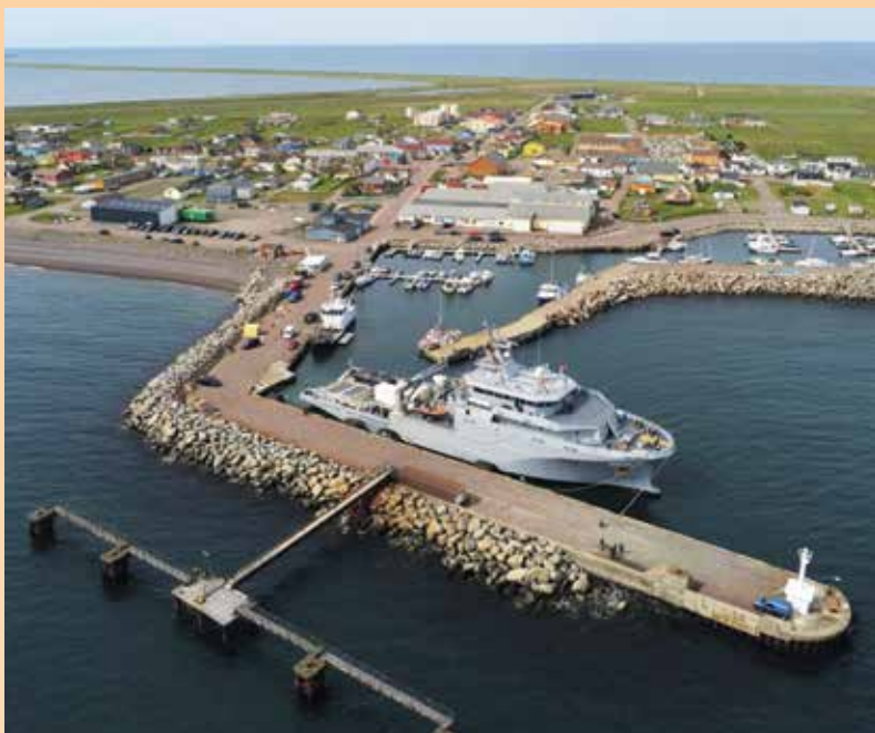
... La Seine en escale à Miquelon

de la montée en puissance de la maîtrise des fonds marins. Il y a en effet deux aspects dans le développement de ce type d'engin : d'une part l'assistance aux sous-marins habités, d'autre part son emploi pour de multiples tâches comme la recherche d'épaves ou d'objets et la surveillance des câbles sous-marins. La majorité des données qui transitent dans le monde se font via ces câbles (on en compte 1500 pour l'instant) qui traversent les océans. C'est un sujet d'attention particulier parce que les communications sont le nerf de la guerre. D'autant que des nations mal intentionnées peuvent être en mesure de les sectionner. L'objectif ici à court terme, c'est de pouvoir surveiller efficacement la totalité de ces câbles et des hubs qui permettent d'amplifier les signaux. Pour l'instant, ces drones sont capables de descendre jusqu'à 1 500 mètres de profondeur. L'objectif d'ici 5 ans, c'est de pouvoir les amener à 6 000 mètres. Suite à cette première phase d'expérimentation achevée avec succès, l'équipage de la Seine a repris la mer vers son port base. Vivement la prochaine mission ! ■