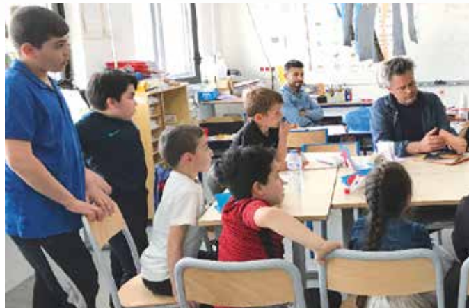
... Le dispositif d'aide aux devoirs « Réussir après l'école » (RAPE)

puissent s'épanouir à l'école, apprendre dans de bonnes conditions, être aidés selon leurs besoins, être accompagnés par les équipes éducatives, municipales et associatives mais aussi par leur entourage familial.