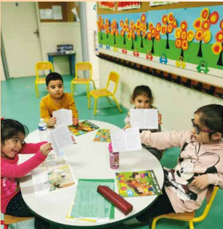
... En grande section de maternelle, les « Clubs langage » permettent aux élèves les plus réservés et moins « parleurs » de prendre confiance en eux afin d'oser s'exprimer en classe ou à la maison.

Le soutien à la Parentalité. Après une année 2021 sous le thème de l'égalité des droits entre les femmes et les hommes, la Municipalité avait décidé, lors du conseil municipal du 28 mars dernier, de faire de la Parentalité sa grande cause municipale pour l'année 2022. Aujourd'hui, plus de 2 parents sur 5 estiment que l'exercice de leur rôle est difficile. La politique de soutien à la parentalité vise donc à répondre à leurs différentes préoccupations relatives à l'arrivée du premier ou d'un nouvel enfant, à sa scolarité, à sa santé, à son équilibre et son développement, aux difficultés relationnelles rencontrées à certaines périodes charnières, etc. Les dispositifs de soutien à la parentalité s'adressent ainsi à tous les parents qui s'interrogent sur l'éducation de leurs enfants au quotidien, quels que soient leur catégorie socioprofessionnelle ou leurs types de vulnérabilités. En valorisant les parents dans leur rôle, le soutien à la parentalité contribue ainsi à prévenir et accompagner les risques pouvant peser sur les relations intrafamiliales (ruptures familiales, relations conflictuelles parents/ados, ...).