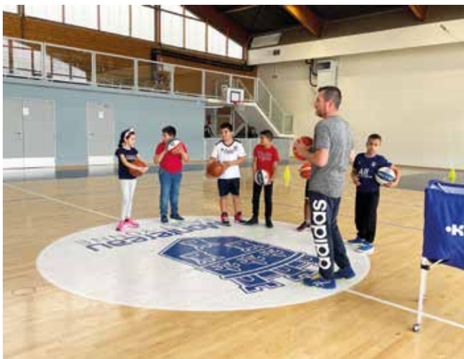
... Apprentissage du basket avec les « Classes à Thèmes »