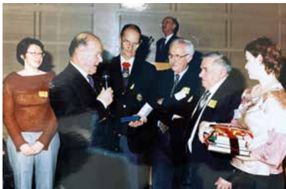
... La belle équipe