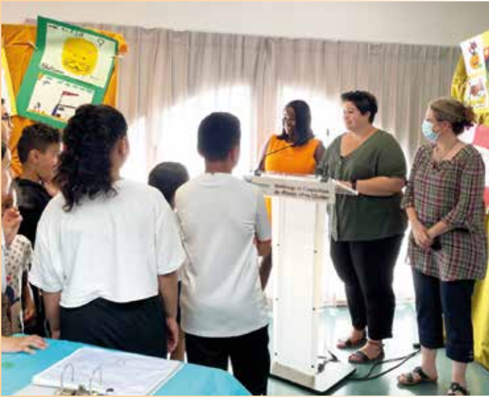
... Vernissage de l'exposition des travaux de fin d'année du dispositif « Réussir Après l'École ».

Le soutien à la Parentalité. Après une année 2021 sous le thème de l'égalité des droits entre les femmes et les hommes, la Municipalité avait décidé, lors du conseil municipal du 28 mars dernier, de faire de la Parentalité sa grande cause municipale pour l'année 2022. Aujourd'hui, plus de 2 parents sur 5 estiment que l'exercice de leur rôle est difficile. La politique de soutien à la parentalité vise donc à répondre à leurs différentes préoccupations relatives à l'arrivée du premier ou d'un nouvel enfant, à sa scolarité, à sa santé, à son équilibre et son développement, aux difficultés relationnelles rencontrées à certaines périodes charnières, etc. Les dispositifs de soutien à la parentalité s'adressent ainsi à tous les parents qui s'interrogent sur l'éducation de leurs enfants au quotidien, quels que soient leur catégorie socioprofessionnelle ou leurs types de vulnérabilités. En valorisant les parents dans leur rôle, le soutien à la parentalité contribue ainsi à prévenir et accompagner les risques pouvant peser sur les relations intrafamiliales (ruptures familiales, relations conflictuelles parents/ados, ...).