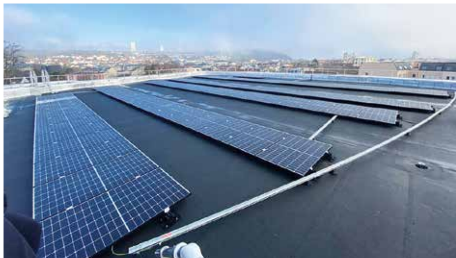
... Le toit du Majestic et ses panneaux photovoltaïques

En matière de transition énergétique, la mairie passe la seconde ! En décembre 2021, le conseil municipal votait la mise en place d'un « plan solaire ». Objectif : diminuer l'empreinte carbone de la communauté monterelaise en utilisant la technologie photovoltaïque. Pour ce faire, la commune procède actuellement au recensement des emplacements potentiels qui pourront accueillir des panneaux solaires. L'idée étant d'étudier toutes les possibilités qui peuvent permettre de profiter de l'ensoleillement pour produire de